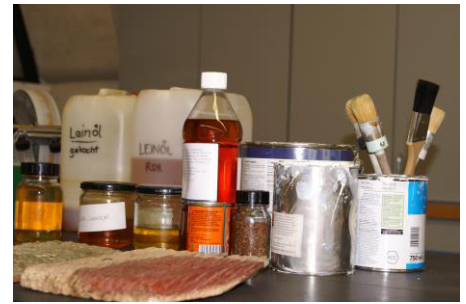
Alte und neue Anstrichsysteme

Klostergasthof, Thierhaupten, Tel. 08271/81810 Gasthof Neue Post, Meitingen, Tel. 08271/2348 Gasthof Neuwirt, Bayerdilling, Tel. 09090/96880