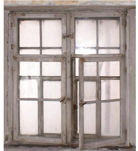
Kreuzstockfenster, 18. Jhdt.