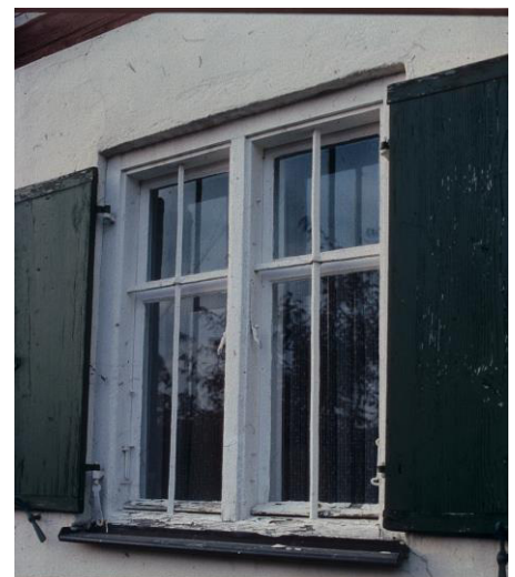
Fenster mit Brettläden, frühes 20. Jhdt.