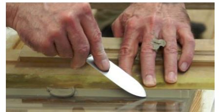
Einkitten von Glas